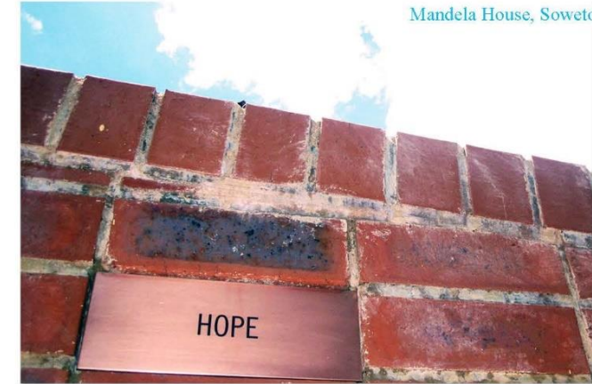
Mandela House, Soweto